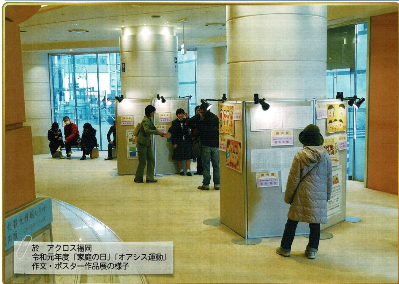
於 アクロス福岡 令和元年度「家庭の日」「オアシス運動」 作文・ポスター作品展の様子