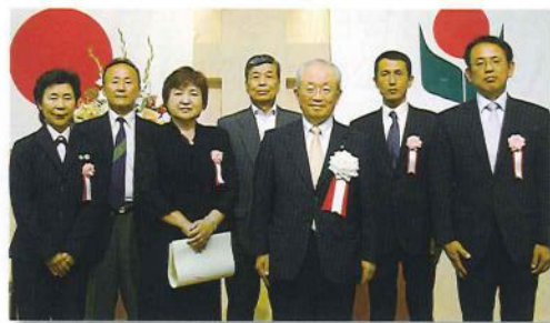
永年表彰を受けた6団体の代表者の皆様

平成5年学校・保護者・地域で連携して学業院中学校生の非行防止及び健全育成を目指し設立されてから毎月第2金曜日に定例会を開催し、学校内外の現状の情報交換を行い、その後、夜間パトロールを実施し、ゲームセンター、カラオケボックス、街頭等において非行防止活動を行っている。